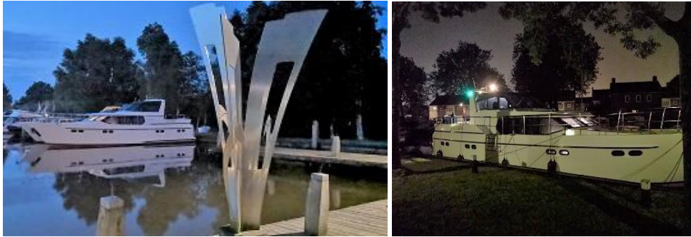
15 Meter Motoryacht JACOBA

Es handelt sich hier um keine Kameradschaft nach Regeln organisierter Vereine mit entsprechenden Posten, sondern um eine offene Gemeinschaft mit gleichen Interessen in Selbstverwaltung (gelebte Demokratie).