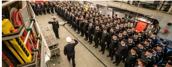
Mehrbesatzungsmodell - Klick auf das Bild

In der heutigen Zeit und in Zukunft werden bei der Deutschen Marine Besatzungen für einen Schiffstyp (Fregatte, Korvette, etc.) als Team Alpha, Bravo, Charlie ... ausgebildet und trainiert, so dass ein Einsatz auf verschiedenen Schiffen einer Schiffsklasse (F125) möglich ist. Es gibt bei der Deutschen Marine mehr Besatzungen als Schiffe. Der einzelne Seefahrende ist keinem Schiff mehr fest zugeordnet. Im Heimathafen wird auch nicht mehr an Bord übernachtet.