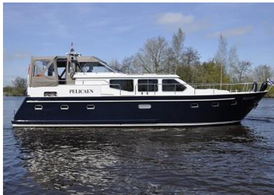
14 m MY Pelicaen 2-8 Personen Yachtwerft Oost NL – Klick auf das Bild

MY „Pelicaen“ für einen Törn (z.Bsp. Mo-Fr) in den Niederlanden buchen? Vor- und Nachsaison ab 1.215 € (2-8 Personen)