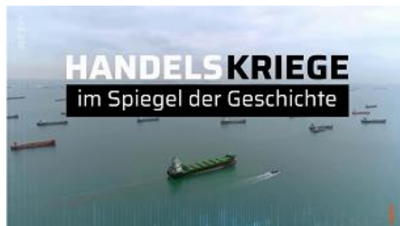
Die Dokumentation versuchte Antworten zu geben, ist aber nicht mehr öffentlich online verfügbar!!! (Privat auf Anfrage)

Mit zu den aktuellen Aufgaben der Deutschen Marine gehört es die Seewege zu sichern.